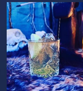
Баня Бабы Яги

Помните ту самую шоколадную конфету Вишня в коньяке? Домашний шоколадный ликер, вишневый сироп и метакса соединились, чтобы ваши вкусовые рецепторы испытали ностальгию.